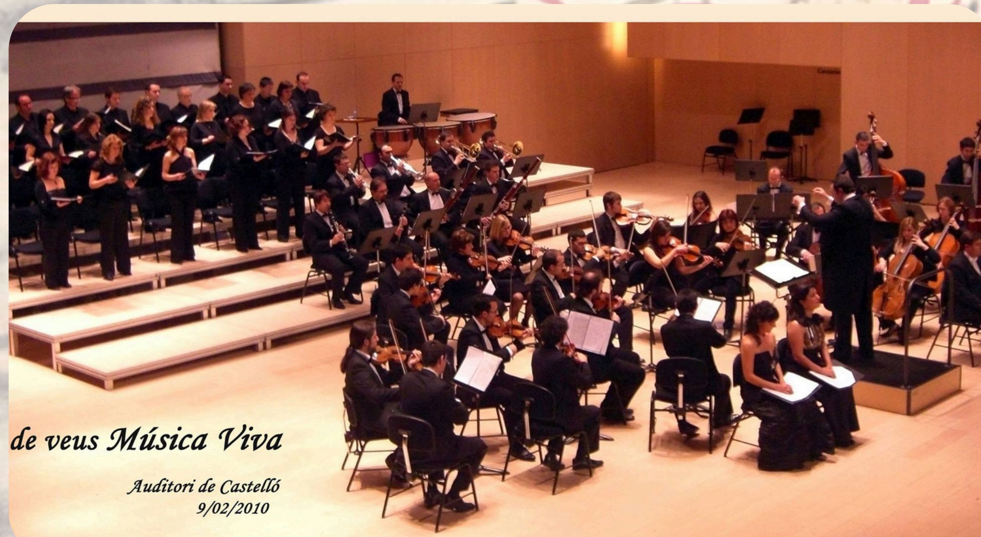
Orquesta y Coro de la Asociación Música Viva

La Asociación MÚSICA VIVA propone este maravilloso proyecto con una orquesta sinfónica de más de 50 músicos, un coro acorde a la plantilla orquestal y 4 solistas de reconocida valía para afrontar el repertorio. Además, tal y como hemos hecho en otros proyectos, se preparará proyección del texto del movimiento final con la traducción del mismo para mejor comprensión de los espectadores o la realización de programa de mano con el texto si no fuese posible.